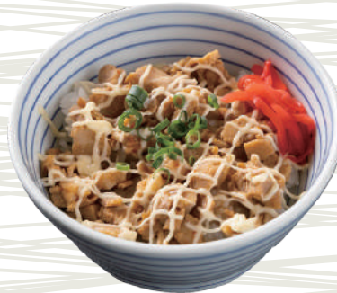
ミニチャーマヨ丼