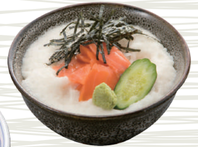
ミニ青森サーモンの 山掛け丼