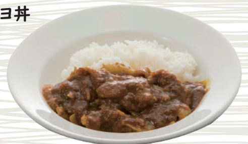
ミニポークカレー