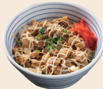
ミニチャーマヨ丼