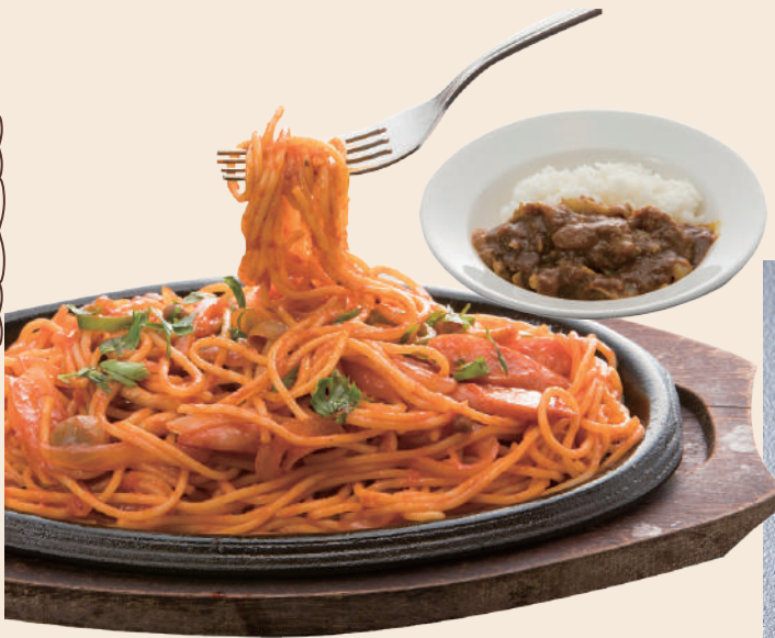
昔ながらのナポリタンと ・サラダ付 ミニカレーセット 1,375円(税込)