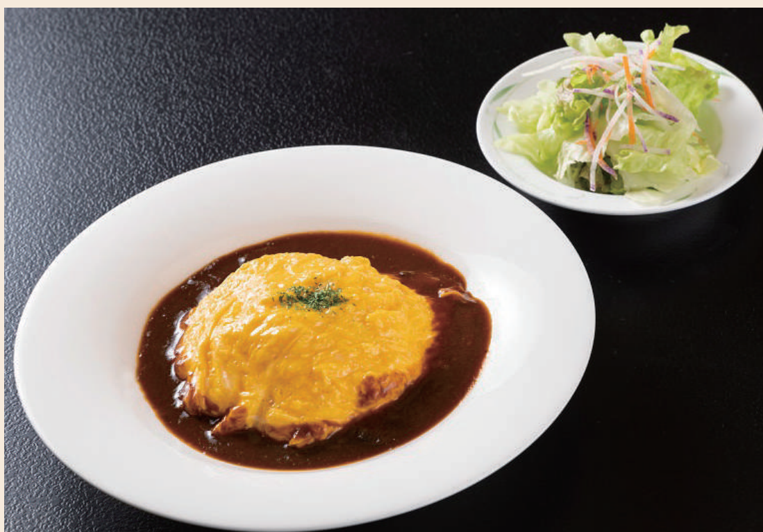
ふわとろオムライス自家製デミグラスソース 880 円 (税込)