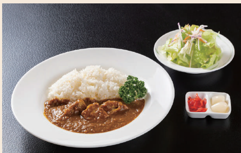
ポークカレー 990円(税込)