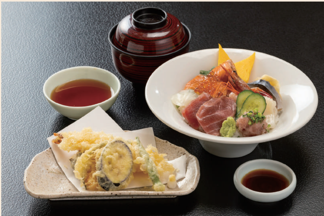
青森サーモン入り海鮮丼と天婦羅セット 2,980円(税込)