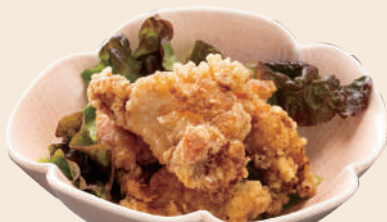
ちよい唐揚げ 330円(税込)