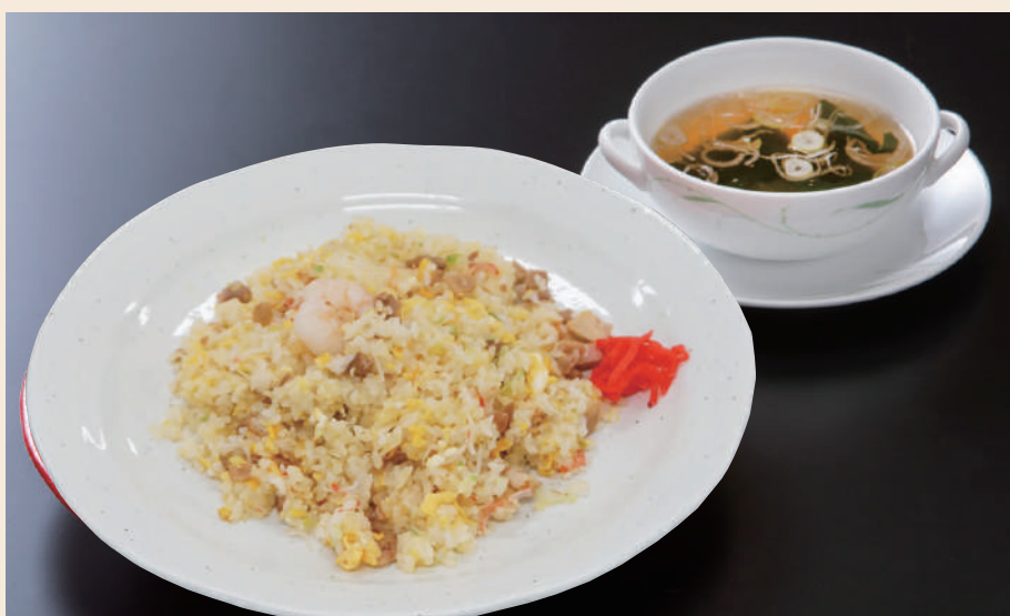
五目炒飯普通盛り