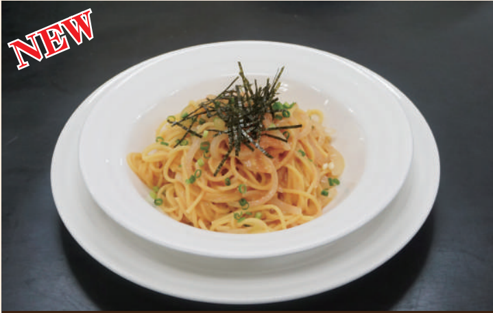
明太子パスタ 990円(税込)