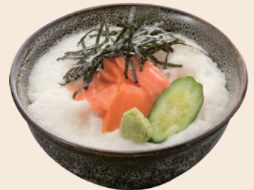
ミニ青森サーモンの 山掛け丼