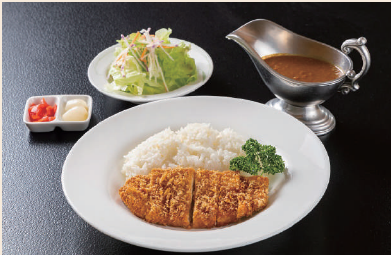
カツカレー 1,320円(税込)