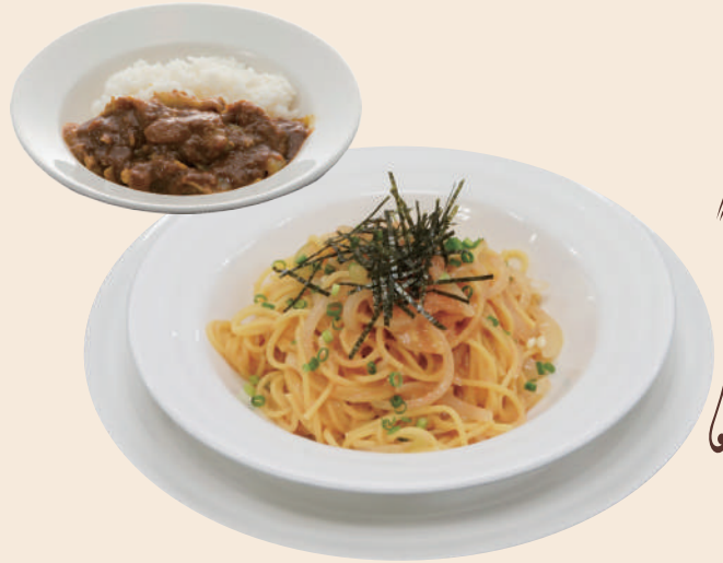
明太子パスタと ミニカレーセット 1,375円(税込)