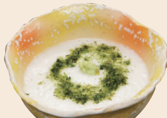
六ヶ所産長芋とろろ 330円(税込)