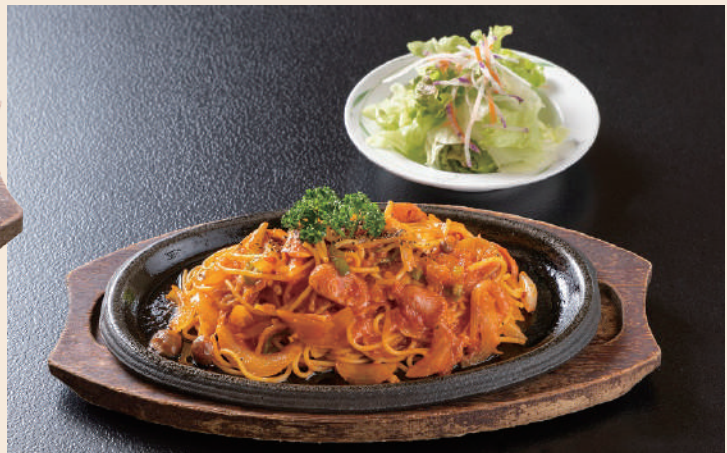
昔ながらのナポリタン 990円(税込)