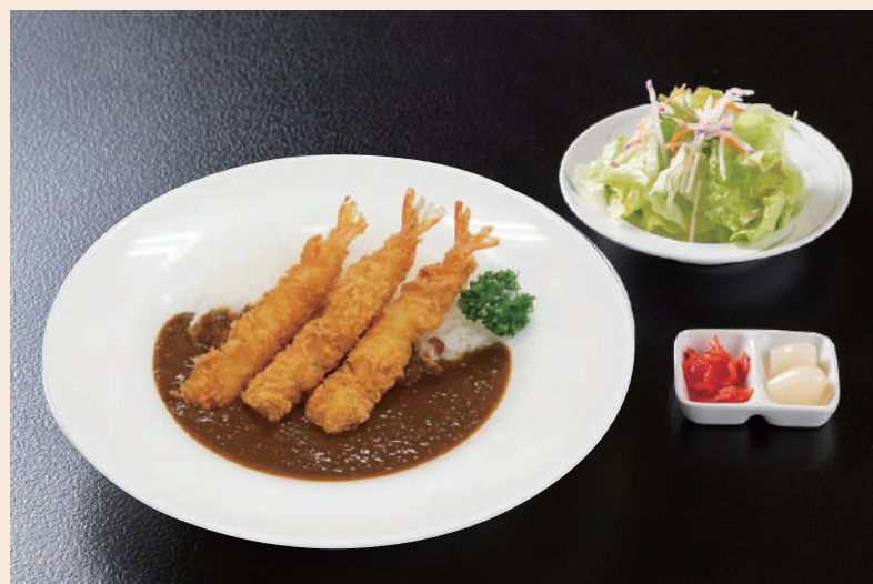
海老カレー 1,210円(税込)