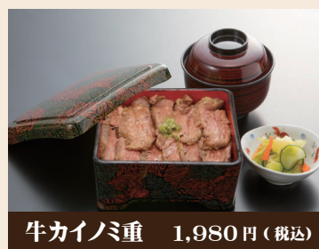
牛カイノミ重 1,980円(税込)