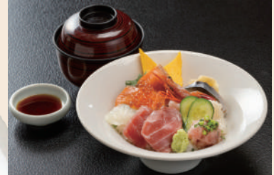
青森サーモン入り海鮮丼 2,750円(税込)