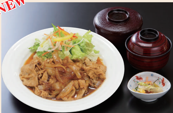
豚の生姜焼きセット 1,430円(税込)