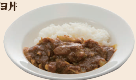
ミニポークカレー