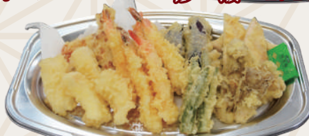
天ぷら盛合せ 1,620円(税込)