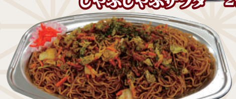
ソース焼きそば 1,620円(税込)