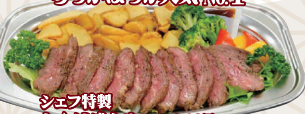
シェフ特製 カイノミ盛合せ 3,240円(税込)

※ご利用日3日前までに ご予約下さい。 ※お届けは総額税込 11,000円以上からになります。