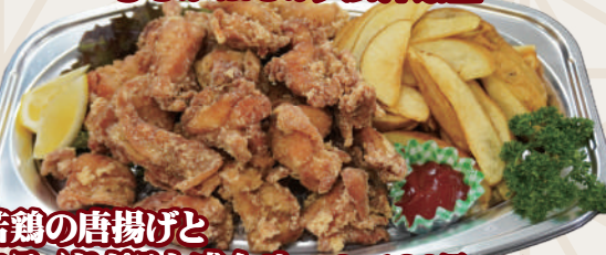
若鶏の唐揚げと フライドポテト盛合せ 2,160円(税込)