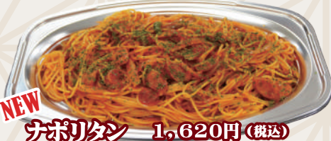
ナポリタン 1,620円(税込)