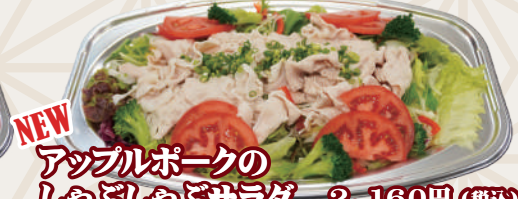
アップルポークの しゃぶしゃぶサラダ 2,160円(税込)