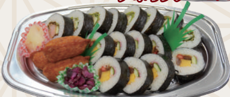
巻物盛合せ 2,700円(税込)