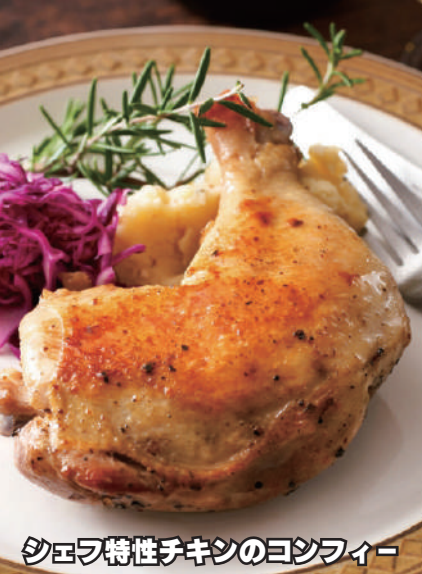
シェフ特製チキンのコンフィー