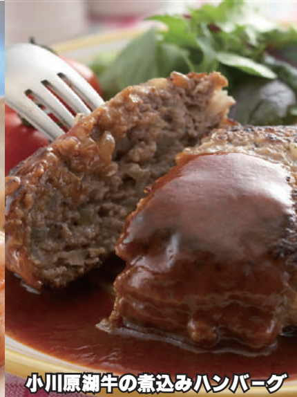
小川原湖牛の煮込みハンバーグ