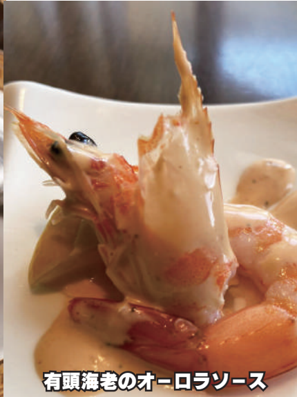
有頭海老のオーロラソース